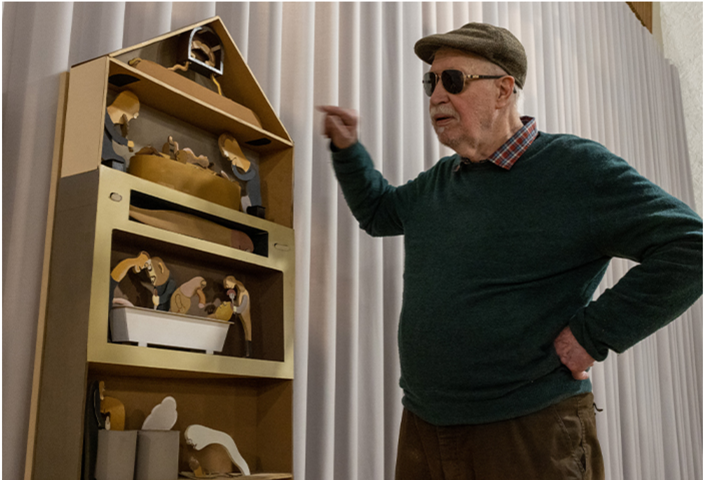
„Das Grauen wohnt den ausgestellten Werken des Frankfurter Künstlers Wolfgang Klee inne“.